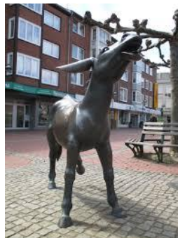
Der Wesel Esel